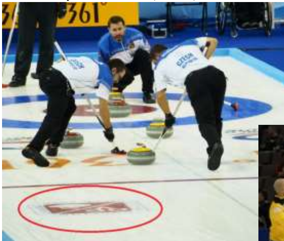
Reklamní plocha v ledu (1 x 1m)