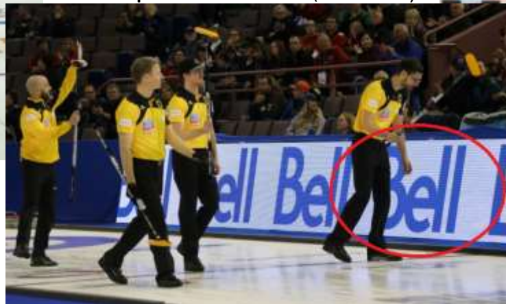
Reklamní plocha na mantinelu (3.7 x 0.76m )